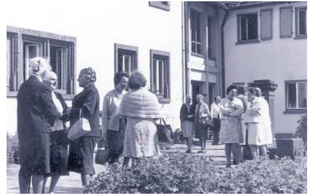
Haupttagung 1970 im Kloster Höchst