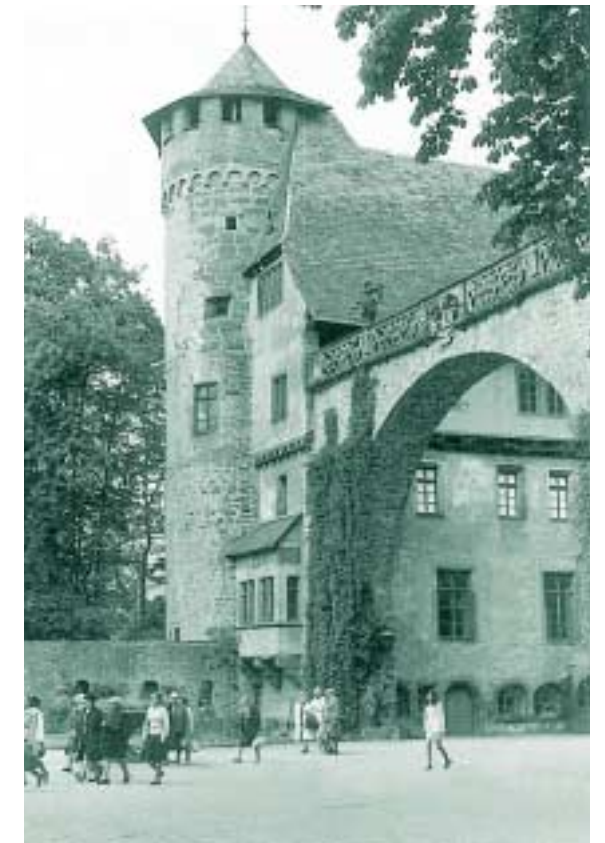
Kloster Höchst, wo die Haupttagungen bis 1978 stattfanden