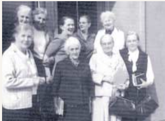
Jubiläumstagung des „Pfarrschwesternbundes“ 1966 in Höchst