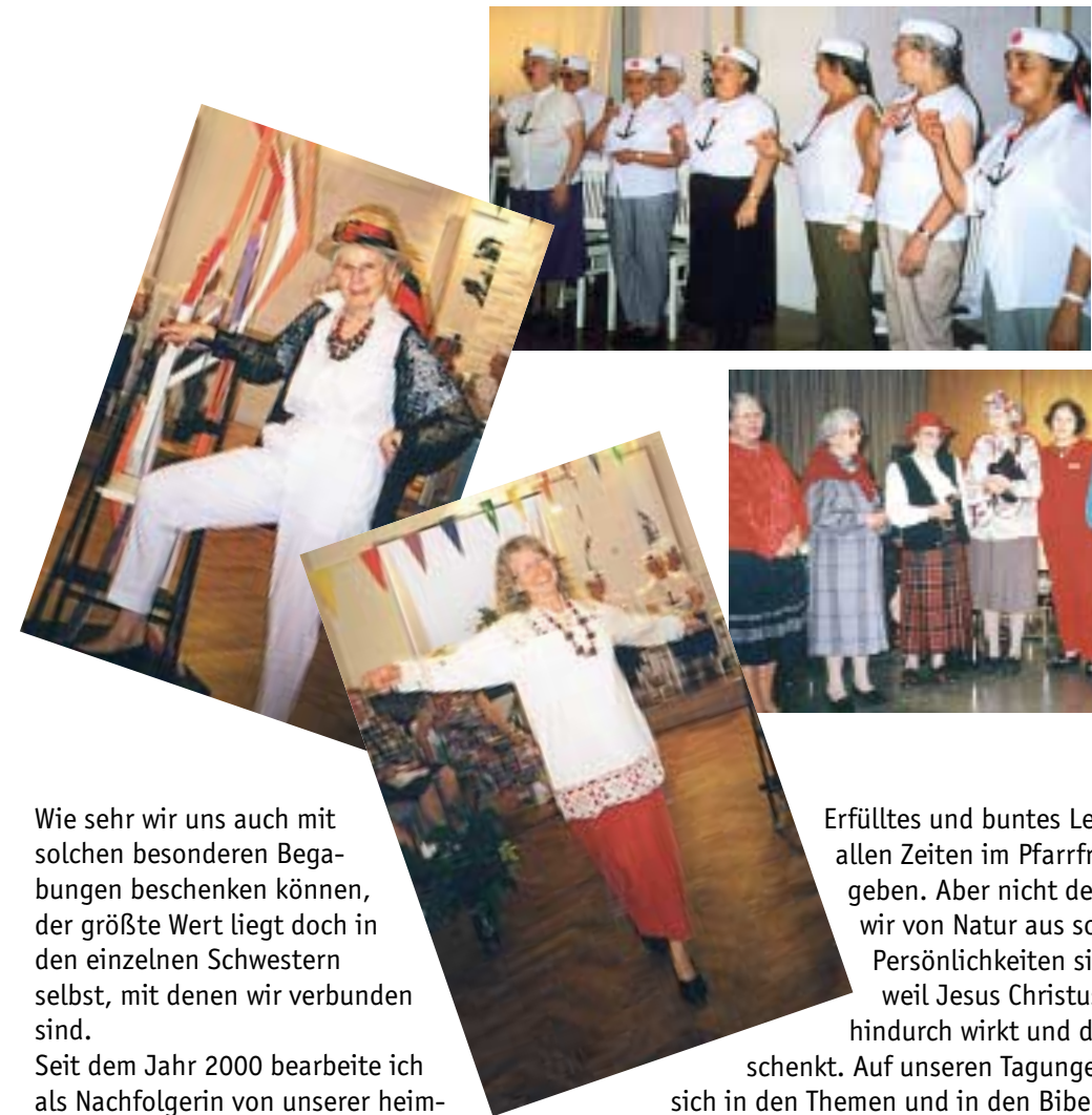
Der festliche „bunte“ Abend bei Tagungen

Und jeder kann es hören, das kleine Ding, und wird es doch nicht wissen, warum ich sing.