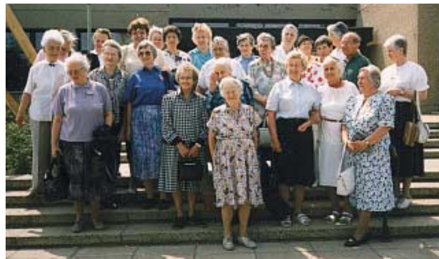
Lobetal-Rüste vor dem Bonhoefferhaus Mai 1992