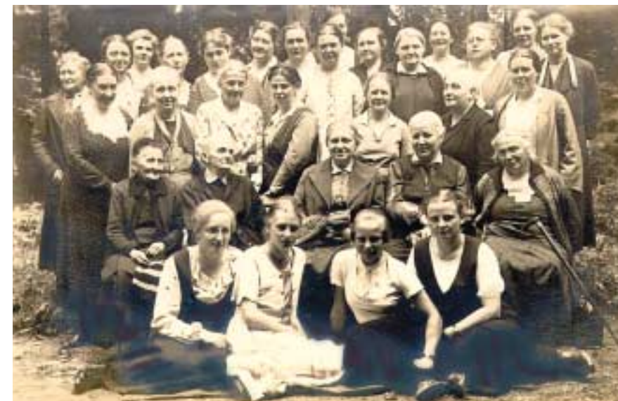
Tagung in den Anfangsjahren des Pfarrfrauen-Schwesternbundes