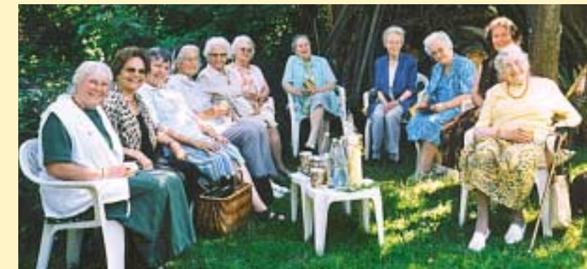
Geburtstagsbesuch der Stuttgarter Schwestern (im Garten bei Familie Wruk)