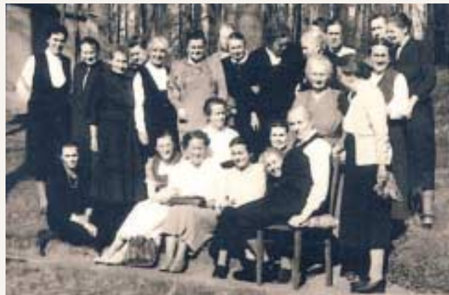
Pfarrschwesternbund- Tagung in Gunzenhausen im Jahr 1959