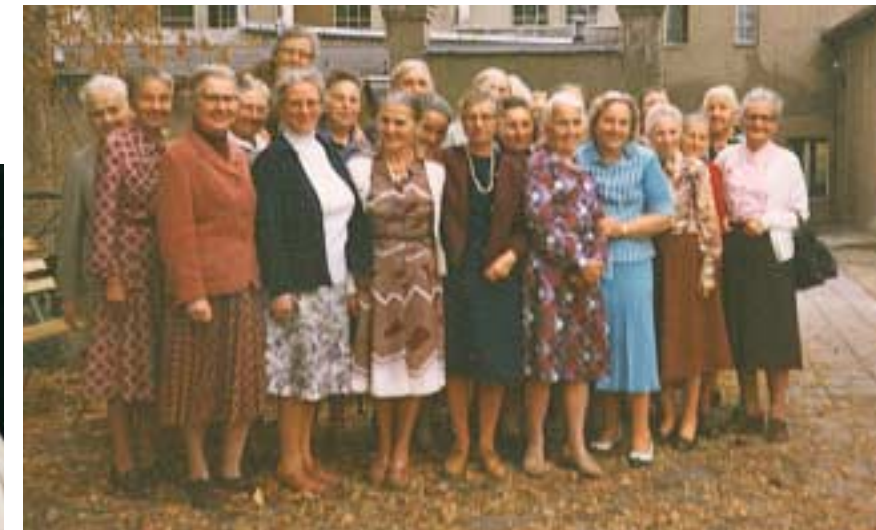
Verantwortlichen-Rüste der Schwestern in der DDR 1979 in Berlin-Woltersdorf