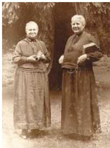
Zwei Pfarrschwestern aus der Zeit der Bundesgründung