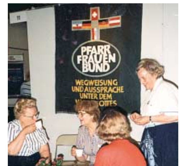
Pfarrfrauenstand auf dem Kirchentag in Düsseldorf 1985

Dies alles wirkte sich erschreckend auch in den Kirchen aus. Überlieferter Glaube und Bibelkenntnis waren deutlich im Schwinden; die Teilnahme am Gottesdienst und in kirchlichen Gruppen ging zurück. Aber die Kirchen hatten immer noch reichlich Geld und konnten ihre Aktivitäten ausweiten. So versuchte man, sich auf das politische Feld auszurichten. Umgekehrt wurden fremde Religionen, besonders aus Asien, attraktiv und verlockten viele. Theologie, Kirchenleitung und Gemeindeglieder lebten sich zunehmend auseinander. Es entstanden „Bekennende Gemeinschaften“, die dieser Entwicklung entgegentraten und enttäuschte Gemeinden und Christen sammelten.